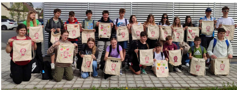
ŽÁCI SI MIMO JINÉ ODNESLI VLASTNORUČNĚ VYROBENÉ BATŮŽKY. text: Markéta Bednářová

České Budějovice/ V pondělí 8. dubna se vypravili žáci třídy