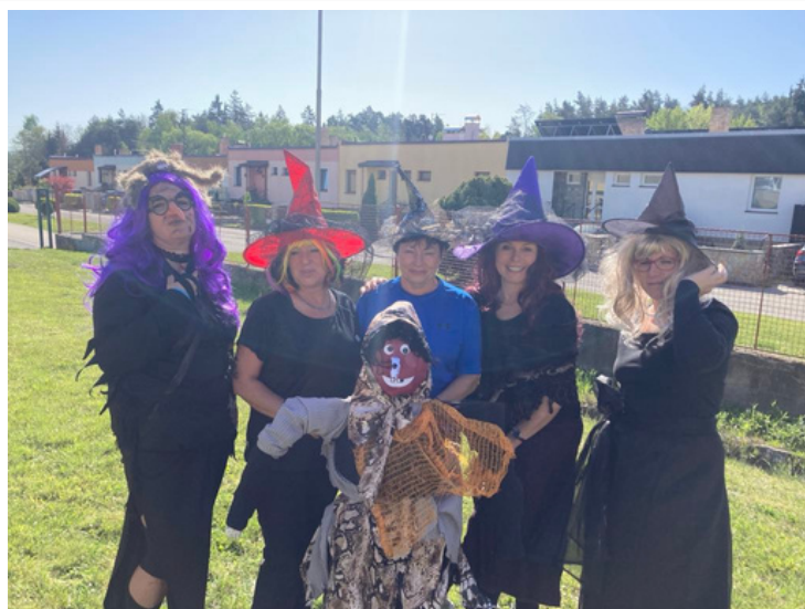
PANÍ UČITELKY SI TO UMÍ S DĚTI UŽIT. Na svých kostýmech si daly záležet, a dokonce byly k nepoznání. Foto: Olga Němcová a text: Lucie Filsaková