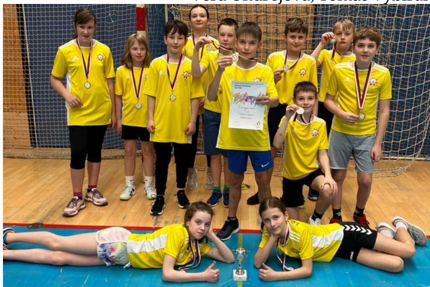
ŠEST VÝHER, MEDAILE A POHÁR. Tým naší školy si z krajského kola odnesl bronzové medaile. Foto: Tomáš Vybíral, text: Lucie Filsaková