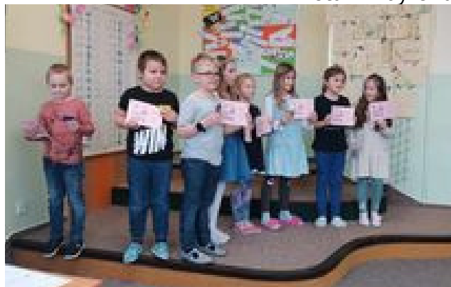
RECITÁTOŘI Z PRVNÍCH TŘÍD. Sice z prvních tříd nebyl žádný postupující, ale letos si prvňáci přednes vyzkoušeli a příští rok třeba někdo z nich bude recitovat v okresním kole. text: Lucie Filsaková