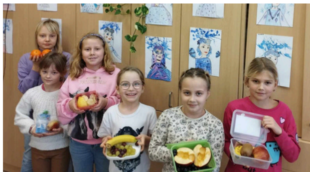
DÍVKY ZAPÓZOVALY S KRABIČKAMI S OVOCEM. V nich byly banány, jablka i mandarínky. text: Lucie Filsaková

V týdnu před jarními prázdninami si děti z prvních a druhých tříd užily zdravé svačinkování. Z domova si nosily pestré svačiny. Také se učily rozpoznat, které jídlo je zdravé.