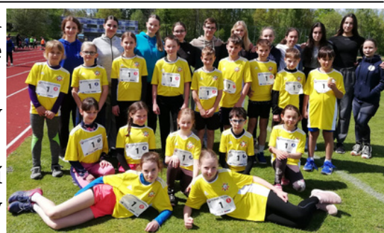
NA ZÁVĚR NECHYBĚLO ANI SPOLEČNÉ FOTO BĚŽCŮ SPOLU S POMOČNÍKY Z DEVÁTÝCH TŘÍD. text: Lucie Filsaková

se na atletickém oválu vedle plaveckého bazénu v Jindřichově Hradci. V první kategorii byly děti z prvních až třetích tříd a