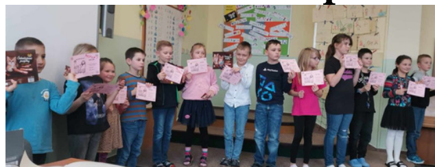
POSTUPUJÍCÍ DO OKRESNÍHO KOLA RECITAČNÍ SOUTĚŽE SI ODNESLI NEJEN DIPLOM, ALE I NĚCO NA ZUB.