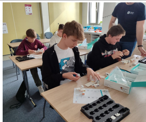
ŽÁKY NEJVÍCE ZAUJALO PROGRAMOVÁNÍ SESTAVOVÁNÍ A PROGRAMOVÁNÍ AUTÍČKA. text: Markéta Bednářová