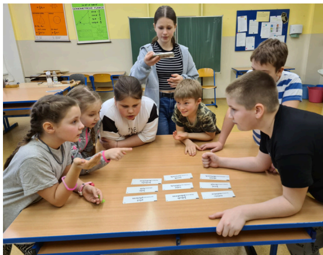
NA CO MARTÍNEK ZAPOMNĚL? Foto a text: Dagmar Tupá

jehož smrti uplynulo 100 let, připravovali nejen učitelé, ale také žáci ze 7. B. Na začátku se děti rozdělily do skupinek, které postupně navštívily pět stanovišť, jež na ně čekala. U každého stanoviště po splnění úkolu dostala skupinka papírek se slovem. Při obcházení úkolů se děti dozvěděly něco o Andersenovi a jeho dílech – četly se povídky i pohádky. Přibližně v polovině večera připravili sedmáci malé občerstvení, aby žáci mohli pokračovat v plné síle. Po nasbírání všech indicií se skupinky sešly opět ve svých třídách a poté nastala volná zábava. Dětem se program velice líbil a sedmáci byli též nadšeni.