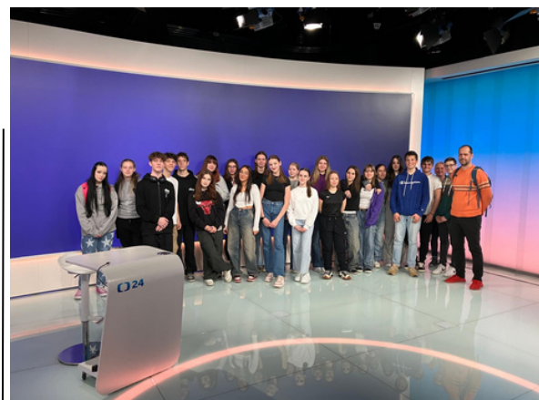
DEVÁTÁCI STÁLI PŘÍMO VE STUDIU, ODKUD SE VYSÍLÁ NAPŘÍKLAD POŘAD HYDEPARK. a text: Lucie Filsaková