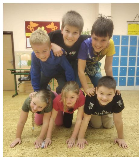
CIRKUSOVÉ STANOVIŠTĚ. Foto a text: Dagmar Tupá

Přibližně v polovině večera připravili sedmáci malé občerstvení, aby žáci mohli pokračovat v plné síle. Po nasbírání všech indicií se skupinky sešly opět ve svých třídách a poté nastala volná zábava. Dětem se program velice líbil a sedmáci byli též nadšeni.