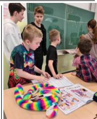
HODINA ANGLICKÉHO JAZYKA VE 3. B. Žáky vyučovali trpěliví učitelé ze 7. B. Foto a text: Daniela Fleischmannová

Pro třídu 2. A si vyučování připravili žáci ze 6. A. „Společně dopoledne bylo protkáno tvorbou, zpěvem, počítáním a nechyběl ani střípek z českého jazyka,“