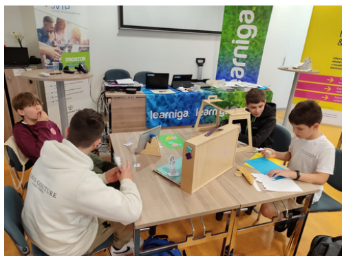
OBLÍBENOU SOUČÁSTÍ ANIMACÍ NAŠÍ ŠKOLY BYL „ROHLÍK“. :-) Foto: Šárka Krušinová, text: Markéta Bednářová

České Budějovice/ V pondělí 8. dubna se vypravili žáci třídy