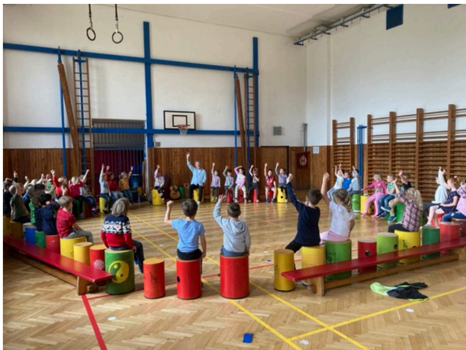
Z TĚLOCVIČNY SE OZÝVALY BUBNY. V pátek 3. května si děti z prvního stupně zabubnovaly na drumbeny. Foto: Olga Němcová a text: Lucie Filsaková