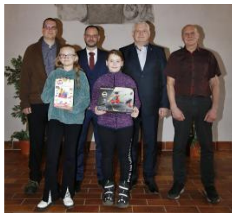
SOUTĚŽ O NEJHEZČÍ VÁNOČNÍ STROMEČEK. Ve středu 7. února zavítali školáci do refektáře muzea v Jindřichově Hradci, kde se dozvěděli výsledky soutěže a byli odměněni. Foto: jh.cz, text: Lucie Filsaková

Sice je červen, ale je nutné zmínit, jak žáci naší školy zdobili vánoční stromek. Nakonec si za jeho zdobení odnesli i cenu.