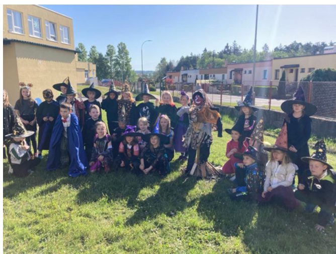
ČARODĚJNICE SE PÁLILY I NA PĚTCE. V úterý 30. dubna i přes větrné počasí pálili žáci prvních a druhých tříd v areálu školy čarodějnice, kterou vytvořily vyučující právě z těchto tříd. Spolu s dětmi si tak užily čarodějnické dopoledne. Foto: Olga Němcová a text: Lucie Filsaková