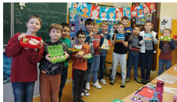
DO AKCE SE ZAPOJILI I CHLAPCI. V krabičkách na svačinu se objevovaly rohlíky i zelenina. Foto: Hana Pragerová, text: Lucie Filsaková